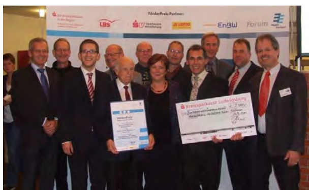
Förderpreis der Region Stuttgart 2010