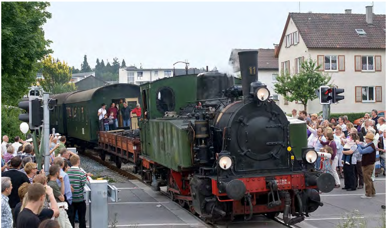
Die Schwäbische Waldbahn als Touristenattraktion