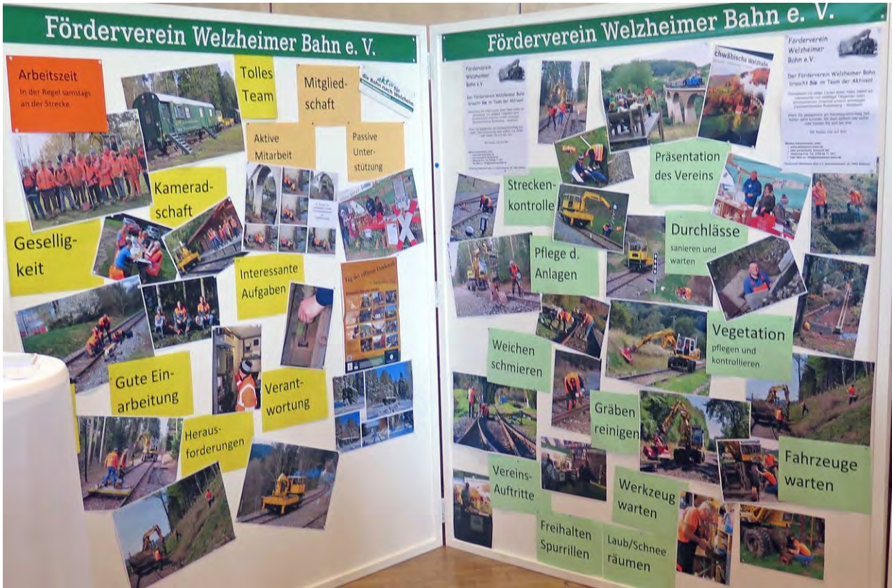
Das bieten wir ....