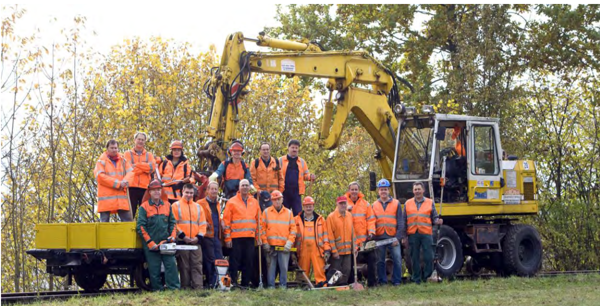
17. März 2000 -2020