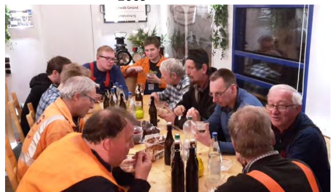
Gemeinsames Vesper nach einem langen Arbeitstag